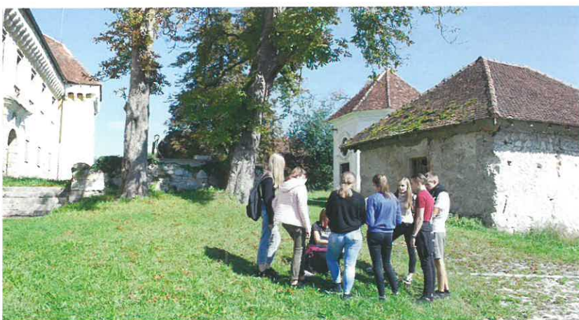
Slika 4: Na vsakem degradiranem območju smo najprej preverili stare podatke iz nacionalne baze, nato vnesli novejšo ugotovitve, ki so jih dijaki zaznali na terenu, sledila pa je diskusija o možnih rabah. Grad Krumperk.