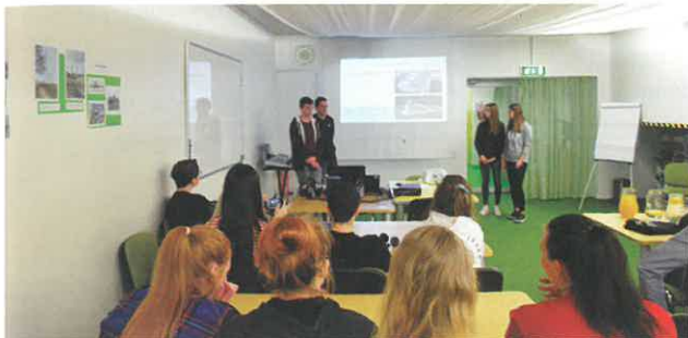
Slika 6: Delne rezultate so dijaki uspešno in suvereno predstavili na obisku v Estoniji maja 2019.

občini. Dijaki so podrobneje predstavili pet območij, ki so se jim zdela še posebej zanimiva. Ker smo vključeni v mednarodni projekt, je bila za dijake dodaten izziv tudi predstavitev v angleškem jeziku.