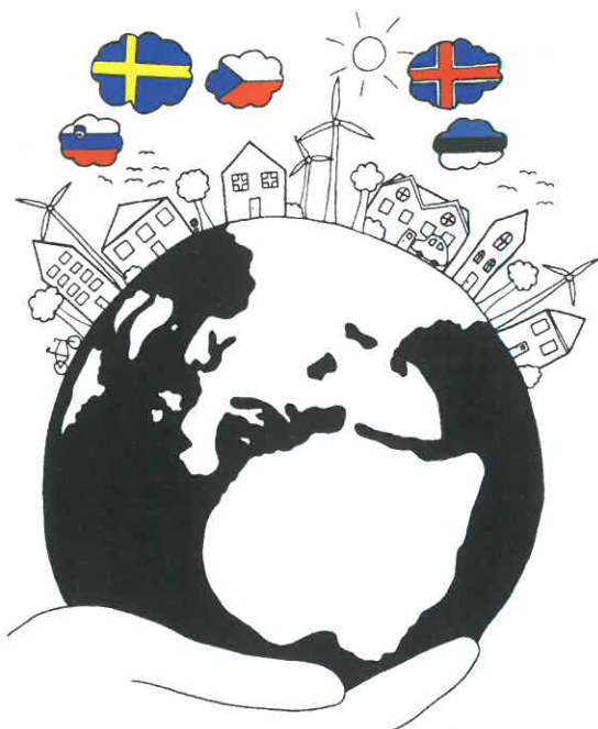
Slika 1: Logotip mednarodnega ERASMUS+ projekta Degradirana območja in trajnostni razvoj

v lokalnem okolju, samo projektno idejo, potek in delne rezultate naših aktivnosti pa podajamo v nadaljevanju prispevka. Geografska raziskava je tudi osrednji vsebinski prispevek k našemu mednarodnemu sodelovanju, kamor je vključenih pet držav, poleg Slovenije (vodilni partner) sodelujejo še šole iz Islandije, Češke, Estonije in Švedske.