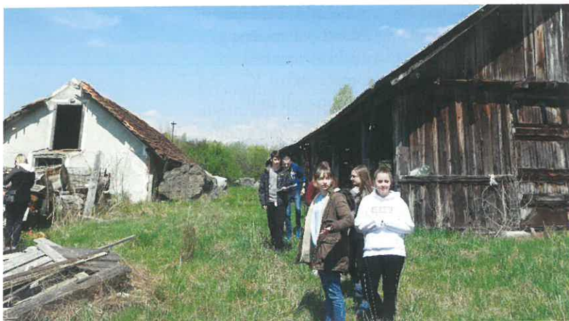
Slika 3: Neposredno terensko prepoznavanje procesov v prostoru in različnih oblik degradacije – najboljši način spoznavanja domače pokrajine. Povsem opuščeno nekdanje kmetijsko območje ROD Radomlje.