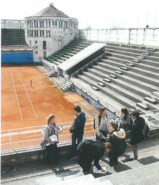
Slika 2: Na terenu smo si ogledali zelo raznolika območja. Varnostnik nam je odprl vrata tudi na več let opuščeno teniško igrišče TEN TEN v Domžalah, kjer si novi lastniki prizadevajo, da bi območje iz nekdanje športne spremenili v stanovanjsko rabo.